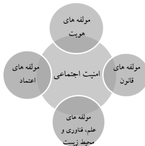
شکل ۱: بررسی چهار مقوله هویت، اعتماد، قانون و علم بر امنیت اجتماعی

مولفه‌های امنیت اجتماعی در چهار مقوله هویت، اعتماد، قانون و علم، فناوری و محیط زیست در سه برنامه چهارم، پنجم و ششم توسعه مورد بررسی قرار گرفتند و راهبردهای مورد نظر هر کدام از این برنامه‌ها برای تحقق مولفه‌های امنیت اجتماعی ترسیم شد.